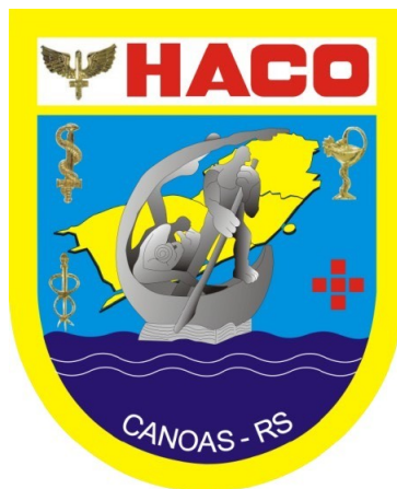
Distintivo do HACO colorido