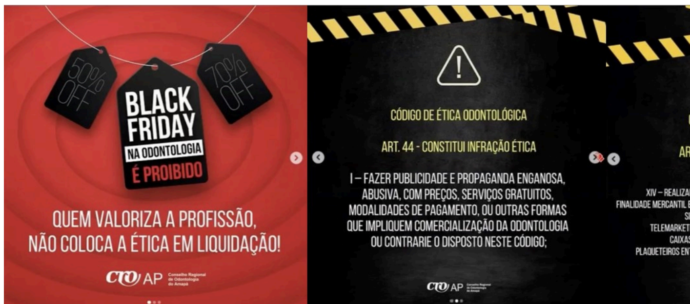
Imagem 2 – Postagem CRO/AP

24. Já o segundo "modelo" de publicação, adotado pelo CRO do Amapá, constam as seguintes imagens: