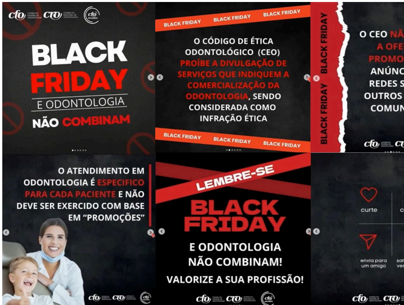
Imagem 1 – Postagem “modelo 1”

23. Conforme resumido no quadro acima, as postagens que seguiram o “modelo 1”, foram realizadas pelos CROs do Acre, Alagoas, Amazonas, Ceará, Distrito Federal, Espírito Santo, Goiás, Maranhão, Mato Grosso do Sul, Minas Gerais, Pará, Paraíba, Paraná, Rio Grande do Sul, Rondônia, Santa Catarina, Tocantins e pelo CFO, sendo acompanhadas das seguintes imagens: