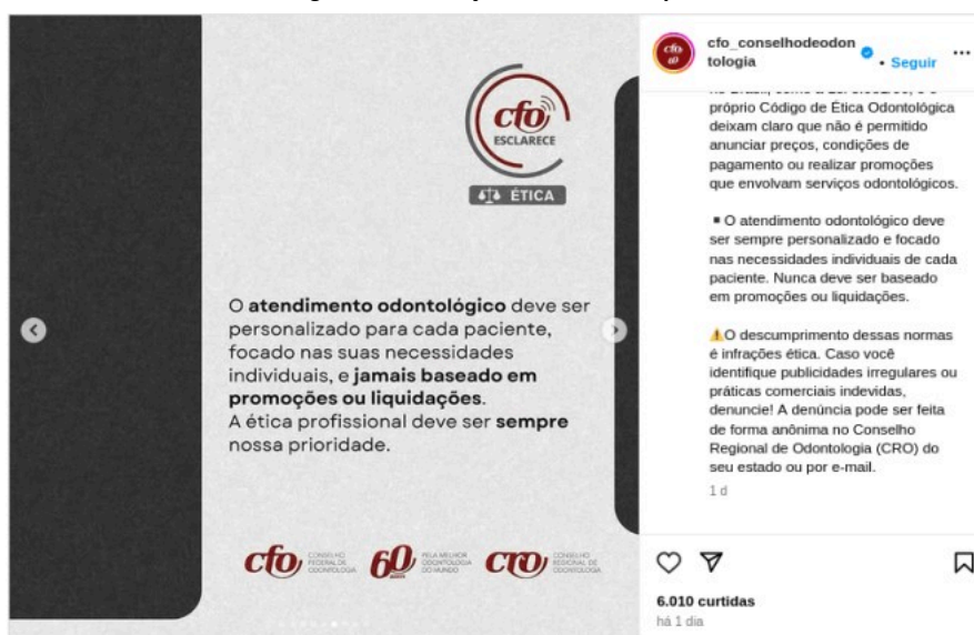
Imagem 13 - Publicação CFO Black Friday 2024