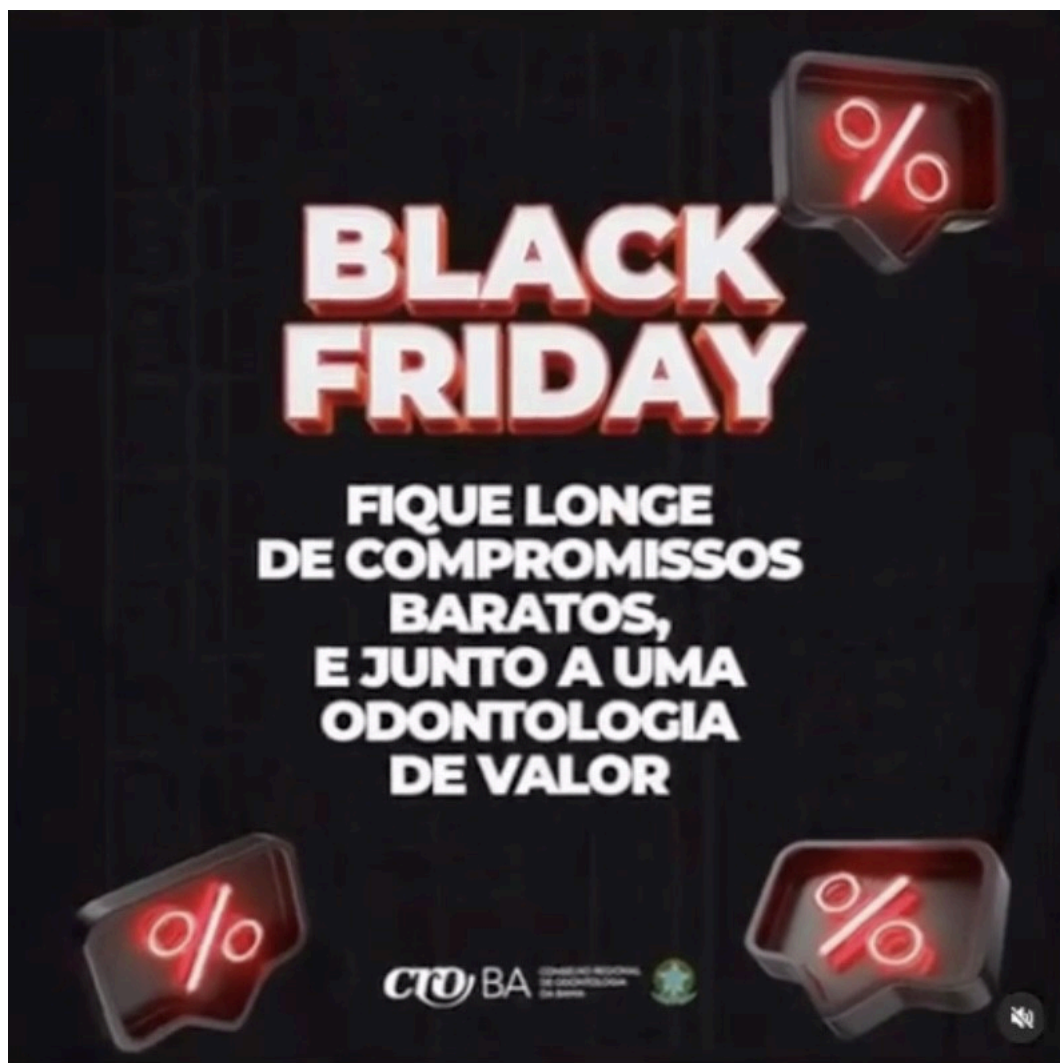
Imagem 3 – Postagem CRO/BA

25. Por fim, as demais postagens, realizadas pelo CRO da Bahia, Mato Grosso, Pernambuco, Rio de Janeiro e Sergipe contaram, respectivamente, com as seguintes imagens: