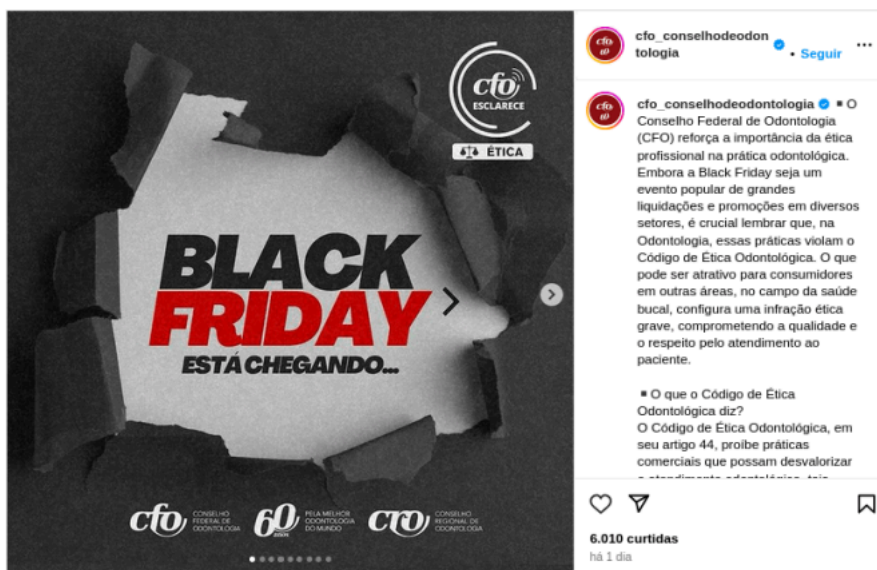
Imagem 8 - Publicação CFO Black Friday 2024

27. Com efeito, importante destacar que durante a instrução preliminar promovida por esta SG, constatou-se que, em 26.11.2024 o CFO novamente realizou postagens em sua página no Instagram com o intuito de associar a concessão de descontos ao cometimento de infrações éticas. Vide: